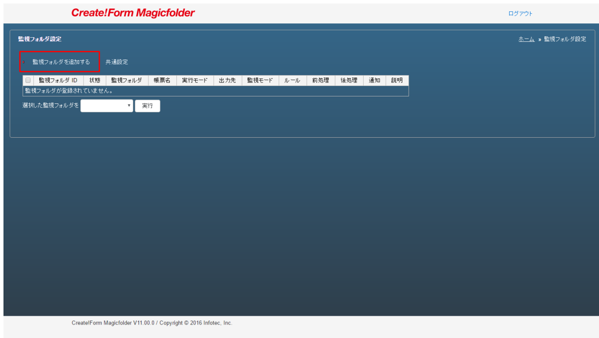
図 2.2 監視フォルダ設定画面

ファイル選択ボタンが表示されるので、クライアントマシンへコピーした監視フォルダ設定ファイルを指定し、「インポート」ボタンをクリックします。